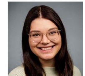
Vivienne Braun Verwaltung