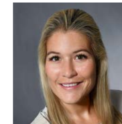
Charlotte Kopp Beratung